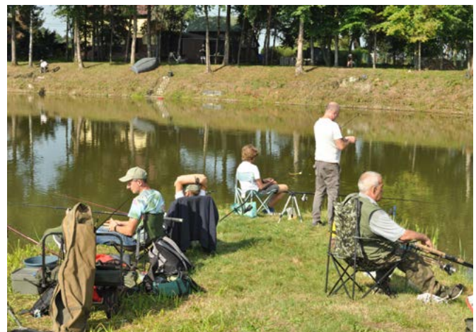
Zawody wędkarskie na akwenu „Miasteczko”

Stowarzyszenie Wędkarskie Kaniowski Karp Królewski (wcześniej funkcjonujące jako Sekcja Wędkarska LKS Przełom Kaniów) od 45 lat dba o dobrostan akwenów i terenów przyległych. Nie tylko łowi i zarybia, ale również sprząta i nasadza zieleń. Współorganizatorzy Święta Karpia Polskiego podkreślają, że są nie tylko wędkarzami – ale w pierwszym rzędzie mieszkańcami społecznie zaangażowanymi w upiększanie gminy. Jak urokliwy jest Kaniów nad stawami