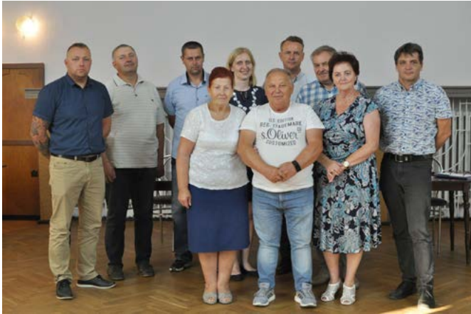
Rada Sołecka w Bestwinie