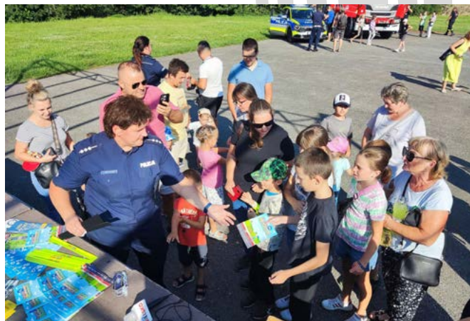
Wszyscy chętni otrzymali gadzety związane z ruchem drogowym

obchodzi się 25 lipca Dzień Bezpiecznego Kierowcy, a tydzień, w którym on przypada to tydzień św. Krzysztofa.