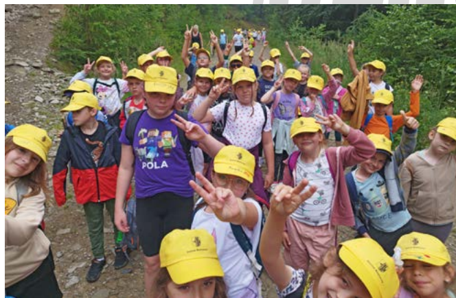
Koloniści na górskim szlaku

Inne spotkanie w ramach półkolonii upłynęło pod znakiem miecza i korony. Dzieci udały się do Warowni Pszczyńskich Rycerzy, gdzie odbyła się wielka bitwa na poduszki, pokonały również tor przeszkód oraz mogły spróbować swoich sił w pieczeniu chleba. Pogoda kolejny raz dopisała, więc rozrywce na średniowiecznym placu zabaw nie było końca. Po powrocie i pysznym obiedzie odbyły się warsztaty.