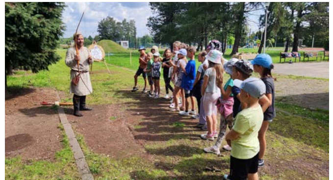
Warsztaty średniowieczne - łucznictwo