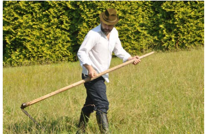
Koszenie kosą - jedna z pokazowych konkurencji

Sianokosy nie mają w gminie Bestwina tak długiej tradycji jak np. Święto Karpia Polskiego, ale zdążyły już okrzepnąć i przyjąć się jako lubiana impreza. Zwykle organizowane były w formie swoistego turnieju sołectw, jednakże 29 czerwca 2024 r. zdecydowano się na bardziej pokazową formułę bez przyznawania miejsc końcowych, co nie znaczy, że nie istniał żaden element rywalizacji. Już sama początkowa prezentacja pokazała mnogość pomysłów strojów, kreatywnych przyspiewek, pojawiły się transparenty, a nawet okolicznościowo przystrojony traktor z przyczepą, wiozący grupę z Bestwinki.