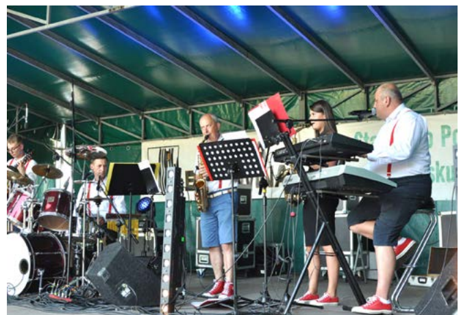
Zespół „Albatros” poprowadził zabawę taneczną