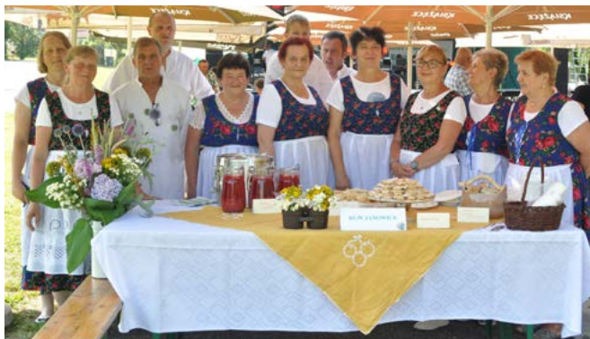
„Swaczyna w pole” - KGW Janowice