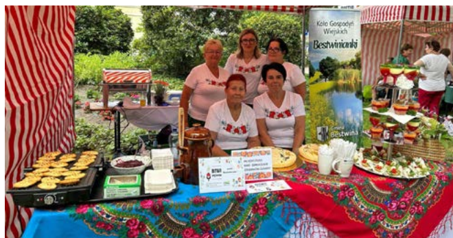
Stoisko KGW „Bestwiniarki”

Organizatorem i fundatorem nagród był Krakowy Ośrodek Wsparcia Rolnictwa – Oddział Terenowy w Częstochowie.