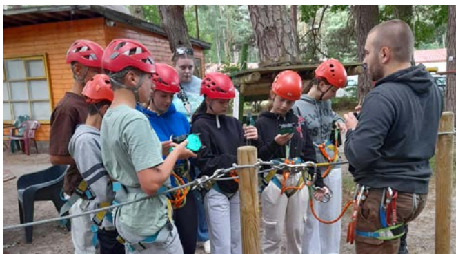
Atrakcji na kolonii nie brakowało

23 kolonia już za nami! Ośrodek Marysienka w pięknym Jarosławcu ponownie gościł dzieci i młodzież z gminy Bestwina. Nasza lipcowa kolonia to każdy dzień pełen atrakcji, konkursów, zawodów i dobrej zabawy. Uczestnicy byli w papugarni, motylarni, w parku linowym, w aquaparku, w wesołym miasteczku. Nasz pobyt składał się również z licznych spacerów, kąpeli w ośrodkowym basenie i oczywiście w morzu. Odbywały się warsztaty taneczne, wzmacnianie mięśni na siłowni, zabawa podczas dyskotek. A najważniejszą rzeczą był uśmiech na twarzach dzieci i młodzieży oraz ogromne zaangażowanie w proponowanych zajęciach.