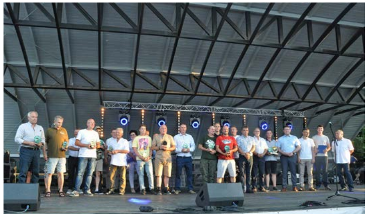
Część oficjalna - nagrody, wyróżnienia i przemówienia

Oferta muzyczna Święta Karpia została przygotowana z myślą o miłośnikach zabaw na parkiecie, klasyki oraz bardziej awangardowych brzmień. Niezmiennie wysoki poziom utrzymuje Orkiestra Dęta Gminy Bestwina z Siedzibą w Kaniowie – utytułowani artyści jesienią będą reprezentować gminę na festiwalu w Meksyku. W Kaniowie nie tylko grali, w repertuarze znalazło się kilka utworów z partiami wokalnymi. Słowacka Kortina (znana ze Święta Gminy Bestwina) wniosła na scenę elementy folklorystyczne i popowe,