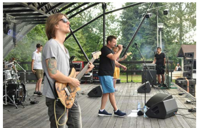
Zespół „Rastafajrant” na scenie