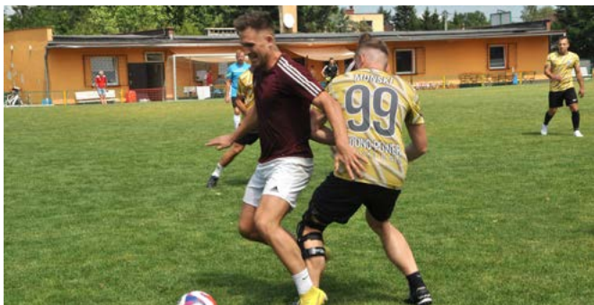
Piłkarskie zmagania w Kaniowie