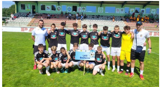
Turniej „Duża piłkarska kadra czeka” - zwycięska drużyna LKS Bestwina

- Również na stadionie w Dankowicach (22 czerwca) odbyła się VII edycja turnieju Wakacje z piłką – szukamy piłkarskich Janków , organizowanego także przez Śląskie Zrzeszenie LZS. Te rozgrywki w roku 2021 były przeprowadzone na stadionie LKS Bestwina. Tegoroczne Janki zgodnie ze swoją ideą pozwoliły na zaistnienie wielu młodych talentów, mamy na myśli zwłaszcza ekipy LKS Bestwina i KS Bestwinka. Drużyna z Bestwiny w grupie finałowej wojewódzkich finałów uplasowała się na miejscu drugim , tylko nieznacznie ustępując zwycięskiej Spójni Landek. Bestwinka zakończyła turniej na