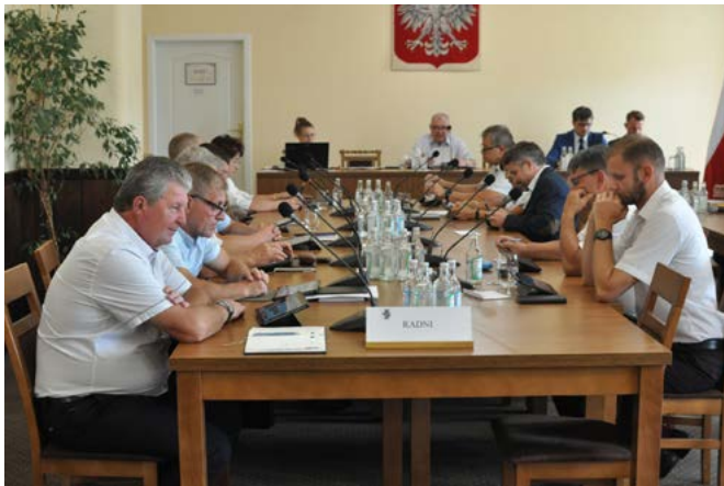
III sesja - radni przy podejmowaniu uchwał

gminy, zwłaszcza przez Kaniów i Bestwinę przeszedł silny front burzowy, który spowodował zniszczenia na budynkach, przerwał sieć energetyczną, powalił i połamał drzewa, blokując drogi, uszkodził infrastrukturę ORiSW w Kaniowie. Poza tym jedna osoba została ranna. Włodarz podziękował Straży Pożarnej i wszystkim, którzy brali udział w usuwaniu skutków kataklizmu. 2. Wójt brał udział w imprezach organizowanych przez różne podmioty z terenu gminy: Piknik rodzinny w Bestwinie, zawody wędkarskie dla dzieci i dla krwiodawców, piknik sportowy stowarzyszenia RAZEM, Międzynarodowy Turniej Kajak-Polo, Święto Gminy Bestwina, Art-Piknik w Kaniowie. Urząd Gminy i GOK włączały się w te wydarzenia także finansowo. 3. Był obecny na zebraniu Towarzystwa Miłośników Ziemi Bestwińskiej, połączonym