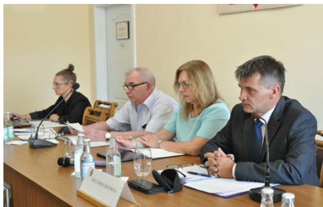
IV Sesja Rady Gminy - prezydium

z wykryciem bakterii kałowych w akwenu ORiSW w Kaniowie, obowiązuje tam do odwołania zakaz kąpielii – reszta infrastruktury jest dostępna. 12. Ogłoszony zostanie przetarg na wywóz odpadów komunalnych. 13. Trwają prace związane z projektowaniem wymiany sieci wodociągowej w Bestwinie i Janowicach oraz bieżącą naprawą ulic i ich obkaszaniem. 14. Do 1 sierpnia można składać uwagi do projektu zmiany nr 1 w Studium Uwarunkowań i Kierunków Zagospodarowania Przestrzennego Gminy Bestwina. 15. Rozpoczęły się prace związane z wymianą ogrodzenia przy przedszkolu w Bestwinie. 16. Do końca lipca zostanie wykonana budowa przyłącza wodociągowego od strony Czechowic-Dziedzic. 17. 10 sierpnia w Kaniowie odbędzie się Święto Karpia Polskiego, natomiast 1 września – Dożynki Gminne w Bestwinie. 18. Nadal trwa postępowanie w prokuraturze dotyczące klubu dziecięcego Puchatek w Kaniowie – kadra jest odsunięta od obowiązków do czasu wyjaśnienia sprawy. 19. Trwa współpraca z Policją dotycząca wzmożonych kontroli na terenie