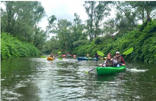
Spływ kajakowy na Wiśle