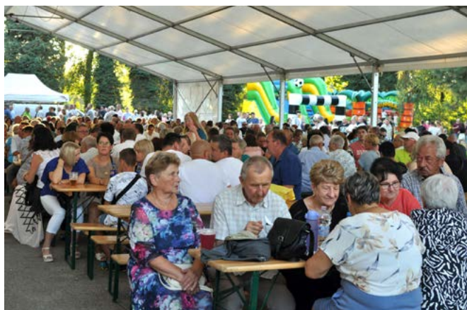
Święto Karpia przyciągnęło licznych gości