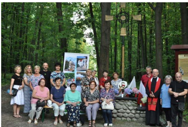
Wspólne spotkanie przy krzyżu w Janowicach

szą wojną światową, koło dwóch równolegle biegnących krótkich okopów z tamtych czasów, gdzie ponoć zostało pochowanych kilku żołnierzy rosyjskich, o czym wspominali moi rodzice i pobliscy mieszkańcy za moich chłopięcych lat. (...) Odśpiewaliśmy modlitwę partyzancką „O Panie, który jesteś w niebie” i oddaliśmy honorową salwę. Pożegnałem chłopaków bratnim uściskiem i rozeszliśmy się każdy w swoją stronę z myślą, czy się jeszcze kiedyś spotkamy.