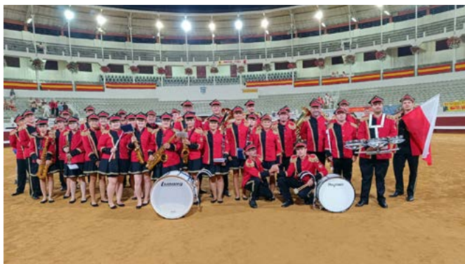
Orkiestra na arenie w Dax

Choć wystąpili na arenie do corridy, to nie musieli wchodzić w rolę torreadorów. Za to zachwycili festiwalową publiczność grą na instrumentach, śpiewem i barwnymi strojami. Orkiestra Dęta Gminy Bestwina z Siedzibą w Kaniowie wybrała się na trwające od 14 do 18 sierpnia święto La Feria de Dax we Francji (region Nowa Akwitania, departament Landy). Ta niezwykle ciekawa impreza przyciąga